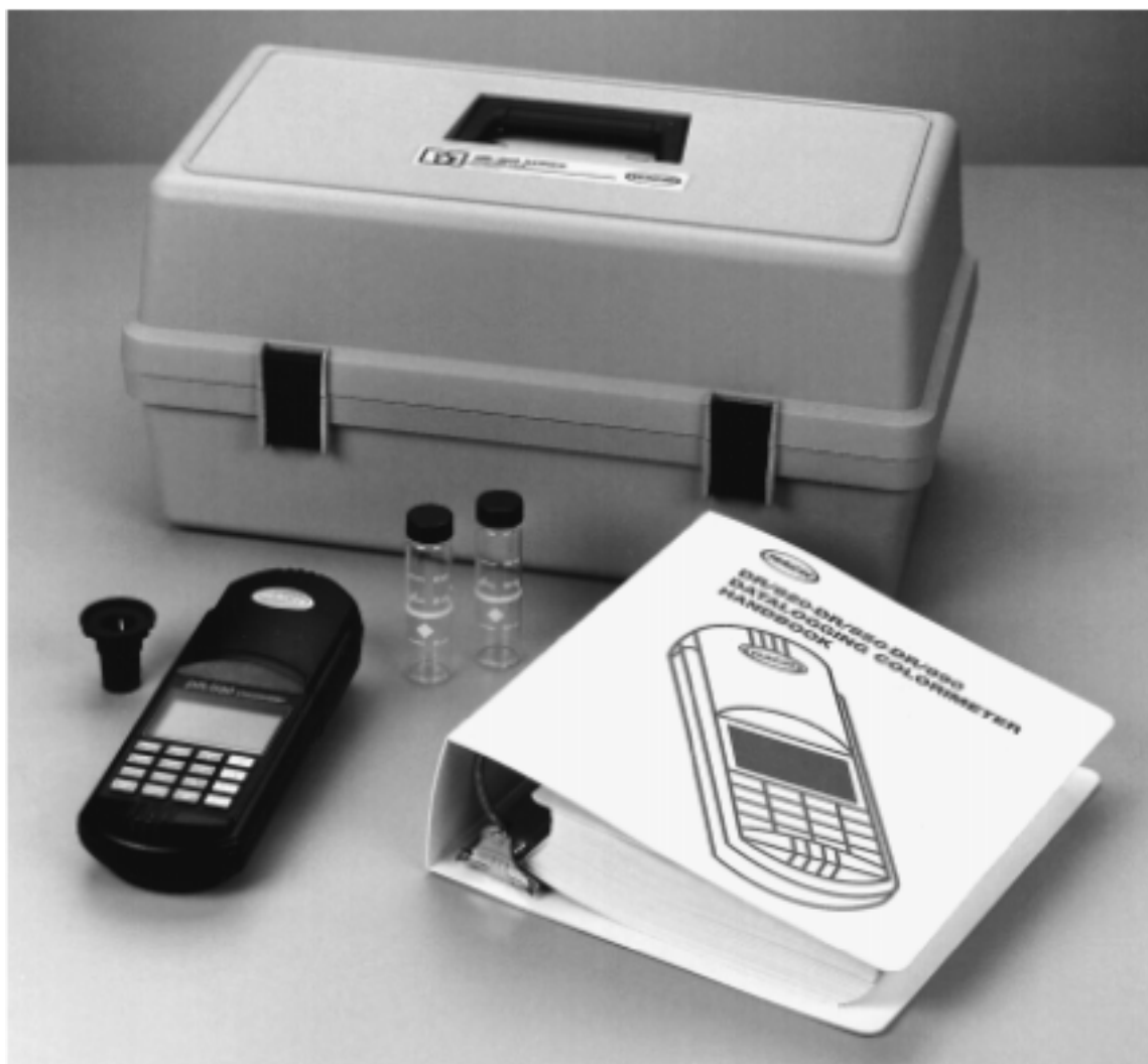
图 1 DR/800 系列色度仪标准包装*